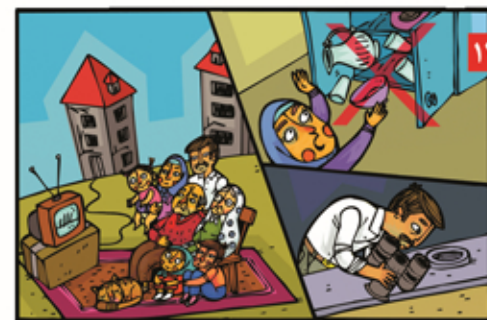
۱۳ بعد از زلزله، کابینت را با احتیاط باز کنیم. سالم بودن لوله بخاری را بررسی کنیم و قبل از برگشت به داخل ساختمان از ایمن بودن آن مطمئن شویم.